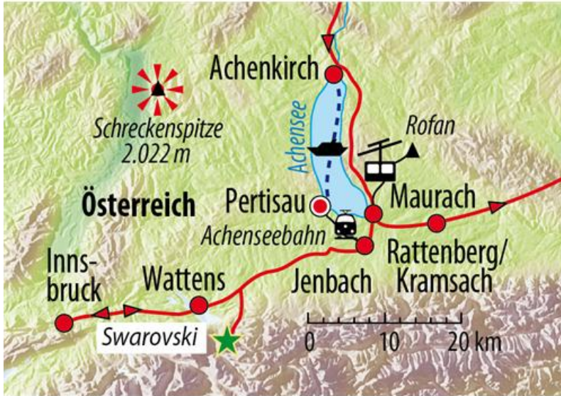
Karte: Eberhardt TRAVEL