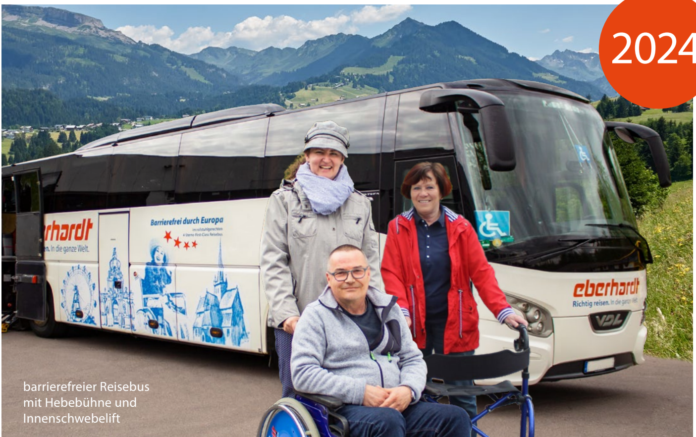
barrierefreier Reisebus mit Hebebühne und Innenschwebelift