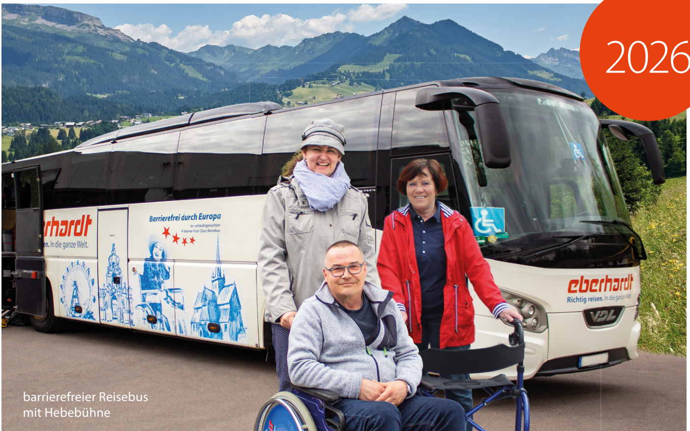
barrierefreier Reisebus mit Hebebühne