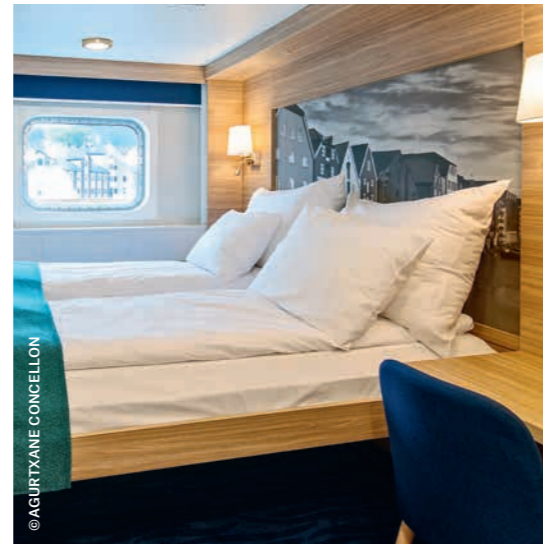
ARKTIS Außenkabine Superior