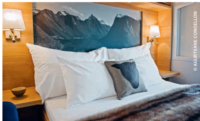
EXPEDITION Suite (Mini-Suite)