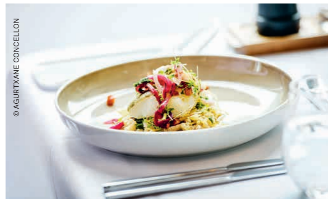
Feinste Speisen à la carte serviert