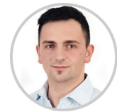
Ihre Reise(beg)leitung ab/an Deutschland