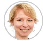
Ihre Reise(beg)leitung ab/an Deutschland