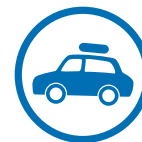
Eigene Anreise ins Zielgebiet oder zum Abflughafen