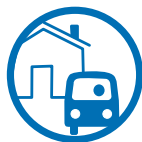
Haustür-Transfer-Service zum Bus-Zustieg bzw. Abflughafen