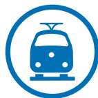
Rail & Fly (Zug zum Flug) zum Abflughafen