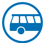
Direkter Zustieg entlang der Fahrt-Route (bei Busreisen)